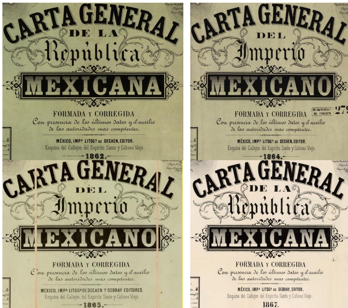
Figura 3. Cartelas de las cuatro cartas alternas de la República Mexicana: 1862, 1864, 1865 y 1867.

En primer término, se encuentra la cartela, que ofrece de forma implícita pistas muy valiosas sobre el significado del material: Carta general de la República Mexicana. Formada y corregida con presencia de los últimos datos y el auxilio de las autoridades más competentes. México, Imprenta Litográfica de Decaen. 10 Se distingue por su elegancia: tamaño, adornos, viñetas y variada tipografía (ver figura 3).