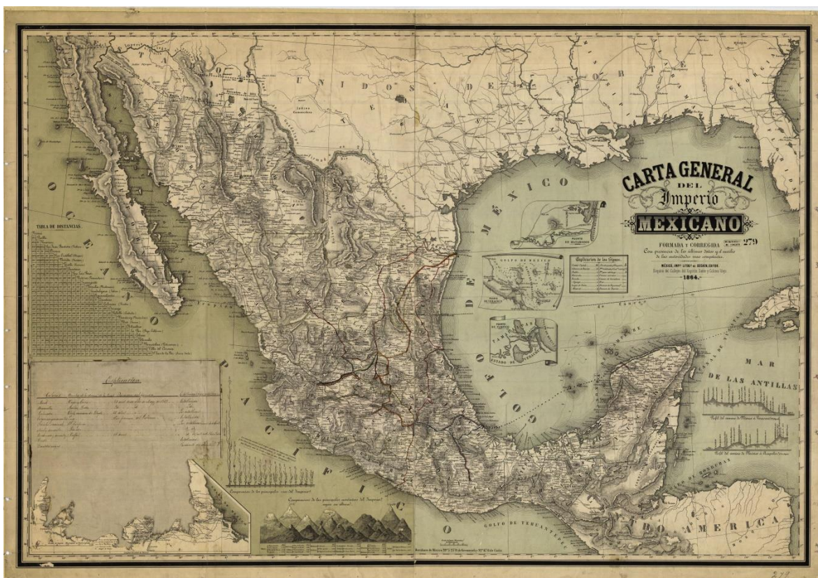
Figura 2. Carta general del Imperio Mexicano . 1864.

como los topográficos, para adaptarlos a la figura espacial de México, lo que consta en la carta general de 1864.